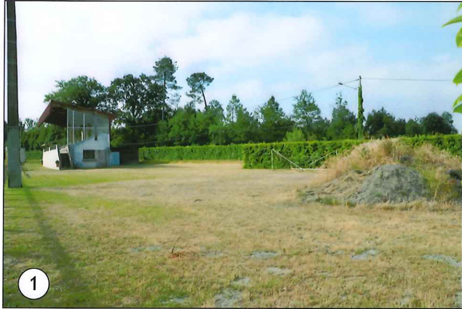
1 Vue de loin