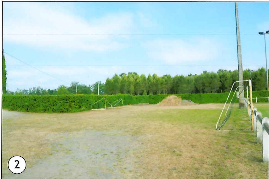
2 Vue de près