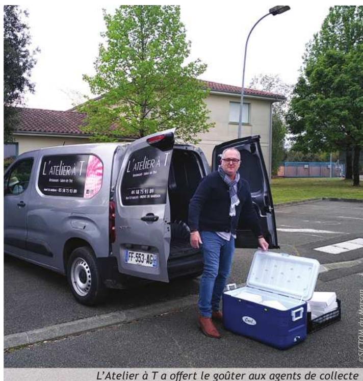
L'Atelier à T a offert le goûter aux agents de collecte

Une autre marque de bienveillance a égayé le quotidien du service collecte, celle de l'Atelier à T. En effet, le vendredi 17 avril, le gérant a rendu la pause plus gourmande en apportant des encas à tous les agents de collecte.